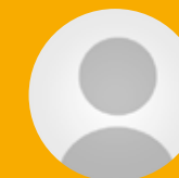
Nog niet bekend Vakleerkracht gym